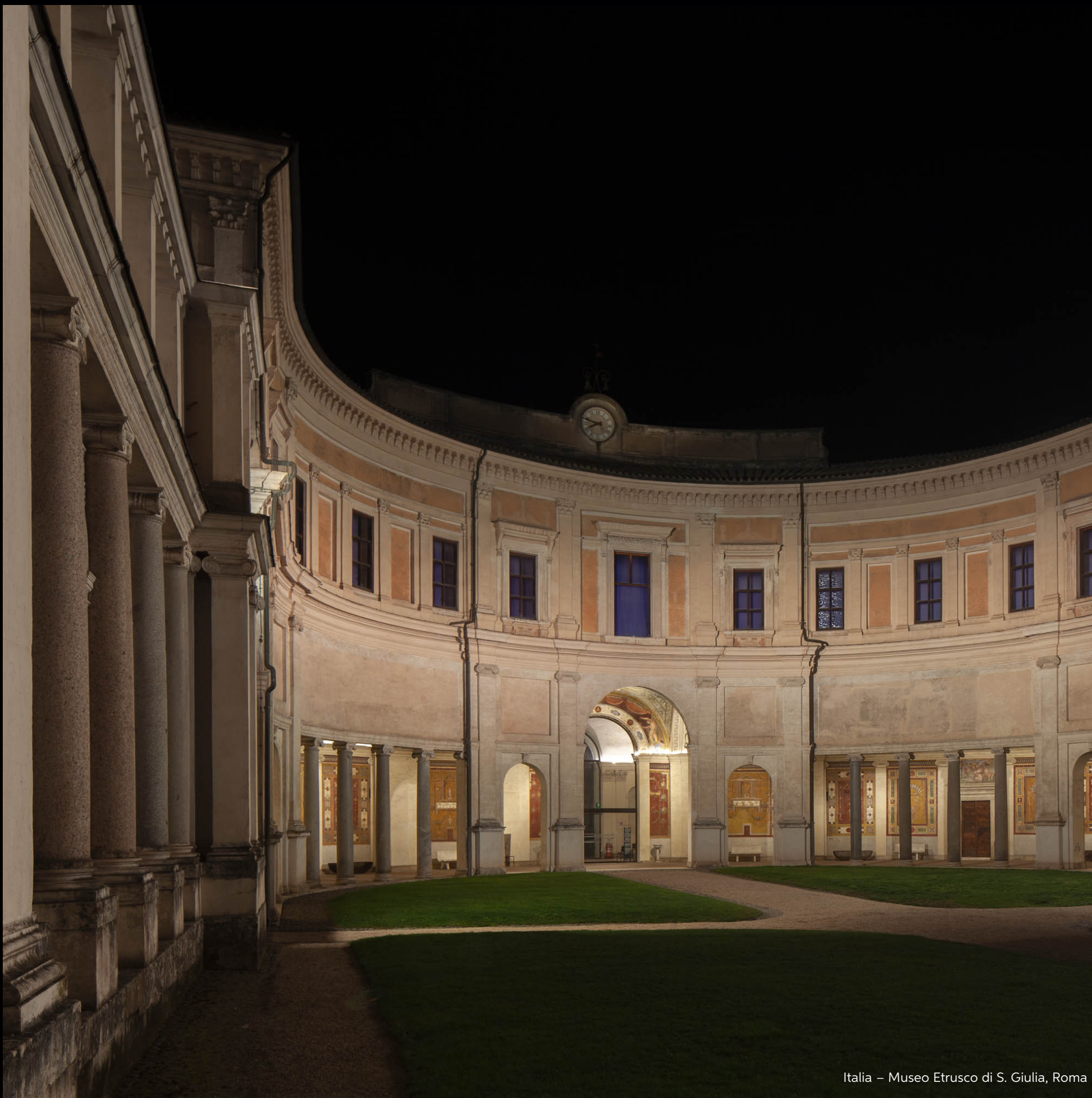
Italia – Museo Etrusco di S. Giulia, Roma